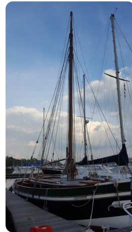
Bälttjer Kutter msp625720 4