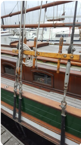
Bild3Bälttjer Kutter msp625720 3