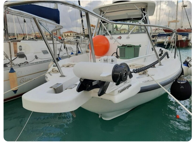
Boston 28 Outrage bow detail