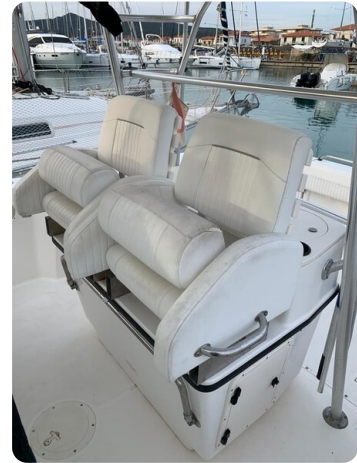
Boston 28 Outrage helm seats