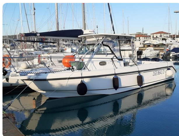
Boston 28 Outrage profile