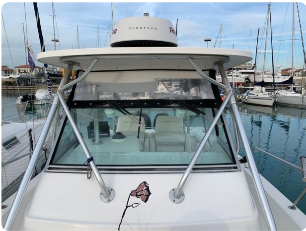
Boston 28 Outrage hard top detail