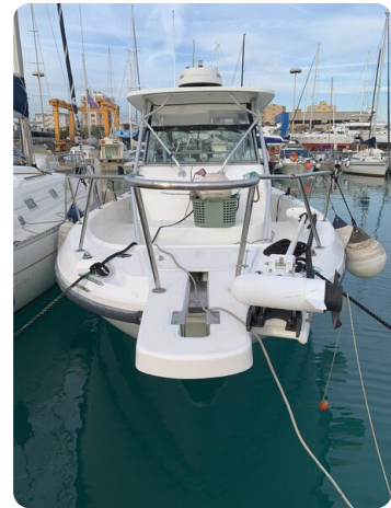
Boston 28 Outrage bow view