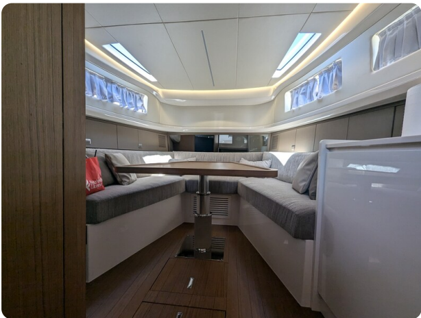
{1} Convertible dinette