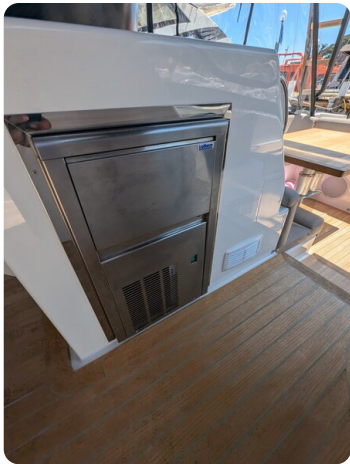
Cockpit ice maker