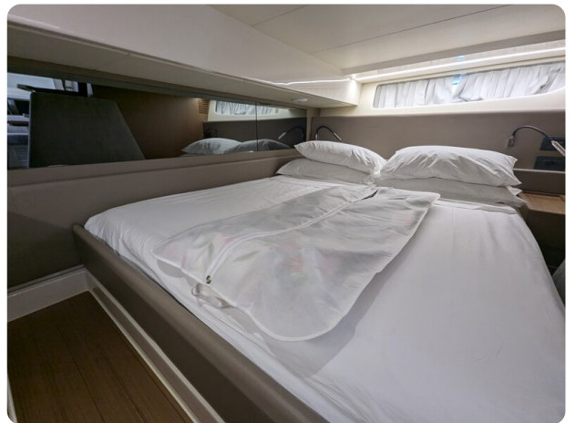
{1} Aft cabin