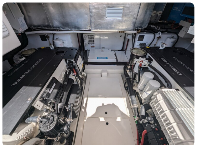
{1} Engine room