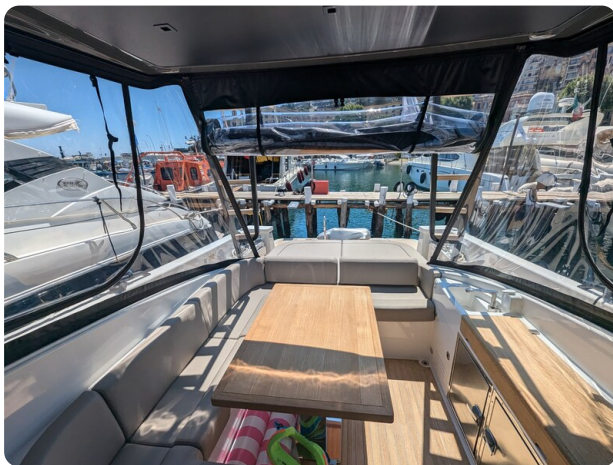
Bluegame 42 cockpit dinette