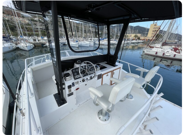
Bertram 33 Sport Fisherman17