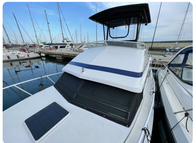
Bertram 33 Sport Fisherman20