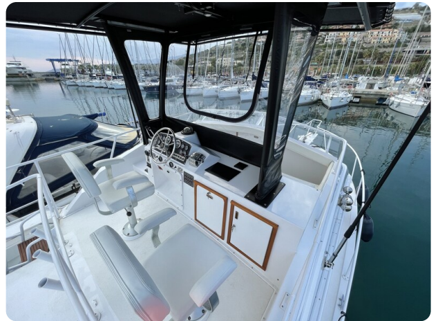
Bertram 33 Sport Fisherman14