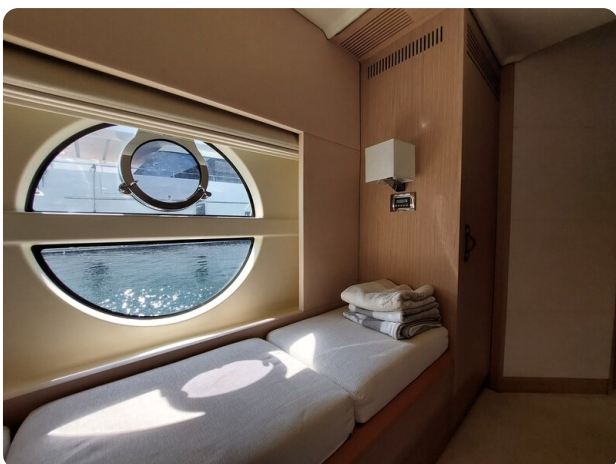
{1} Owner's cabin detail