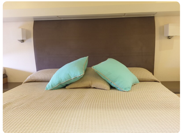
{1} Owner's cabin