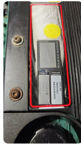
Bavaria 37 Sport msp793423 33