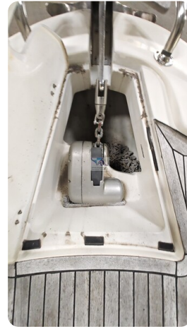
Bavaria 37 Sport msp793423 12