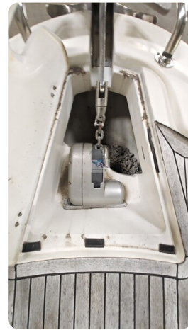
Bavaria 37 Sport msp793423 12