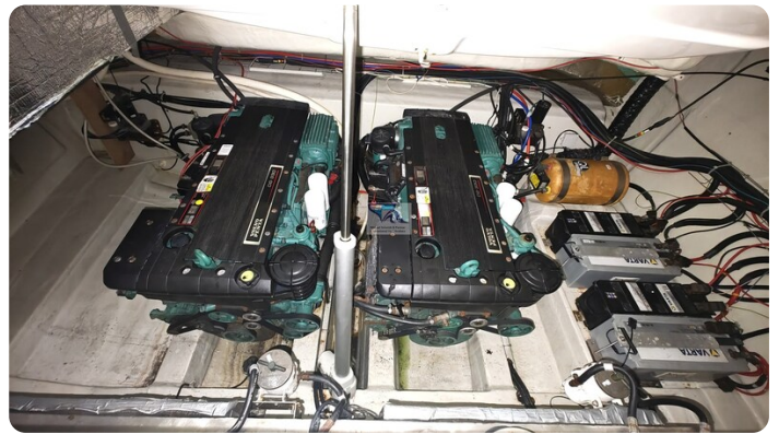
Bavaria 37 Sport msp793423 36