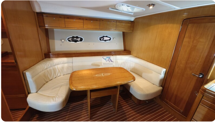
Bavaria 37 Sport msp793423 52