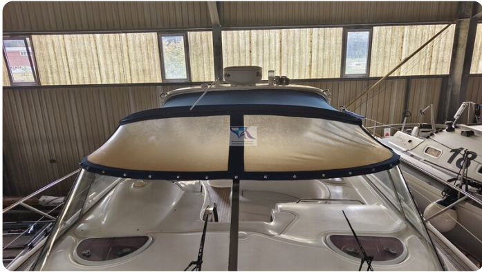
Bavaria 37 Sport msp793423 16