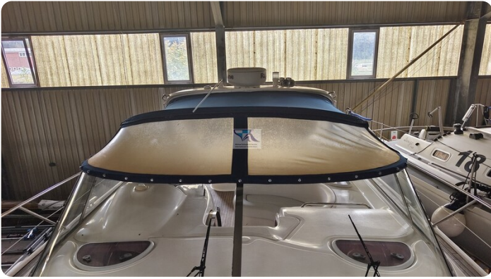
Bavaria 37 Sport msp793423 16