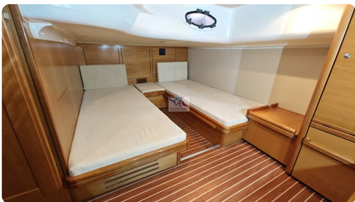
Bavaria 37 Sport msp793423 48