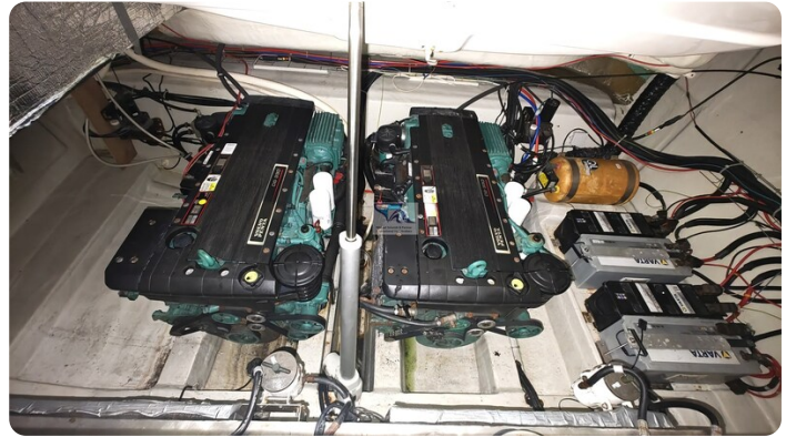
Bavaria 37 Sport msp793423 36