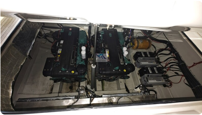
Bavaria 37 Sport msp793423 35