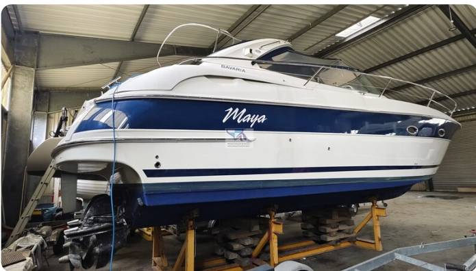
Bavaria 37 Sport msp793423 1