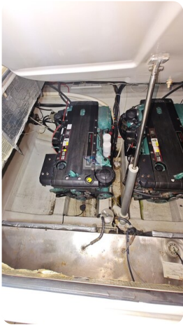
Bavaria 37 Sport msp793423 41