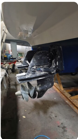
Bavaria 37 Sport msp793423 2