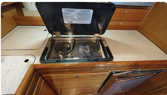
Bavaria 37 Sport msp793423 68