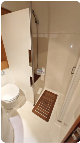
Bavaria 37 Sport msp793423 62