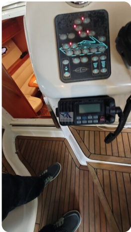
Bavaria 37 Sport msp793423 31