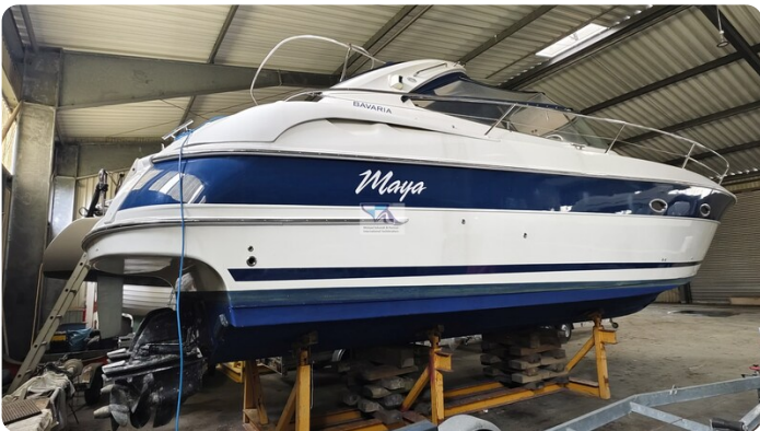
Bavaria 37 Sport msp793423 1