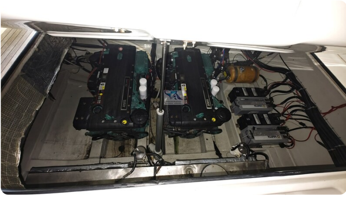
Bavaria 37 Sport msp793423 35