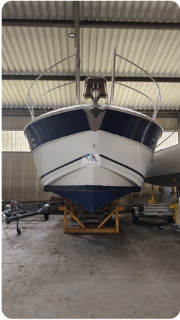
Bavaria 37 Sport msp793423 6