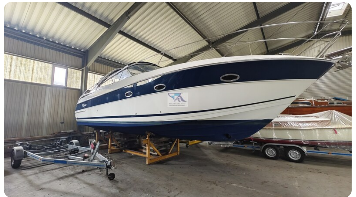
Bavaria 37 Sport msp793423 4