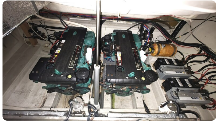
Bavaria 37 Sport msp793423 36