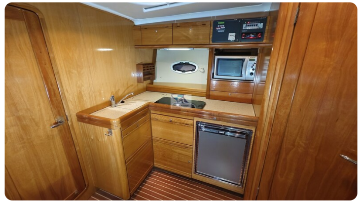
Bavaria 37 Sport msp793423 63