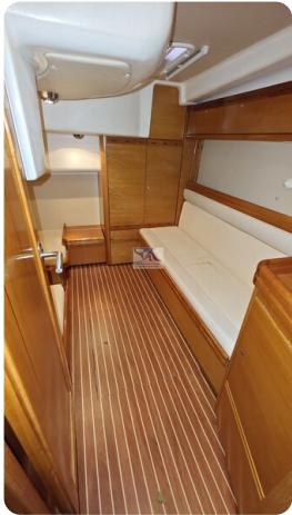
Bavaria 37 Sport msp793423 43