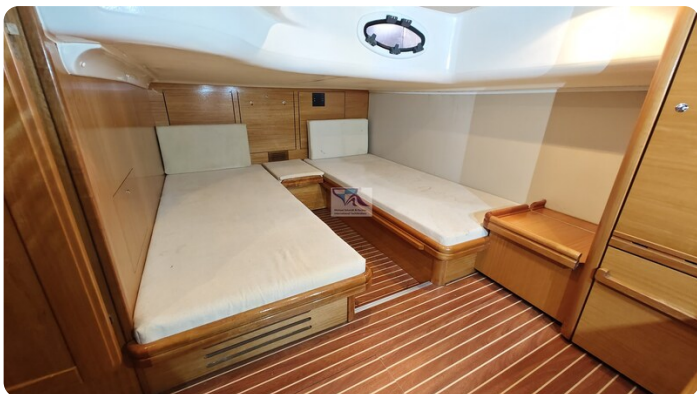
Bavaria 37 Sport msp793423 48