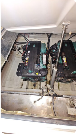
Bavaria 37 Sport msp793423 41