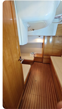
Bavaria 37 Sport msp793423 47