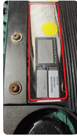
Bavaria 37 Sport msp793423 33