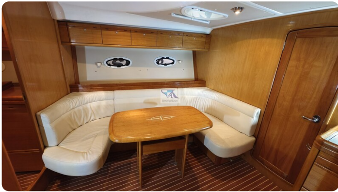
Bavaria 37 Sport msp793423 52