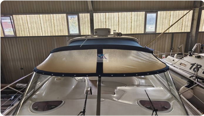
Bavaria 37 Sport msp793423 16