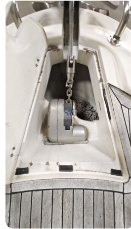
Bavaria 37 Sport msp793423 12