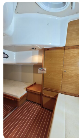
Bavaria 37 Sport msp793423 49