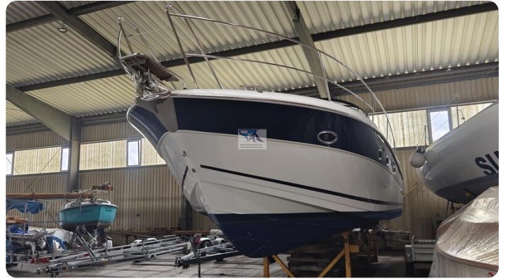
Bavaria 37 Sport msp793423 7