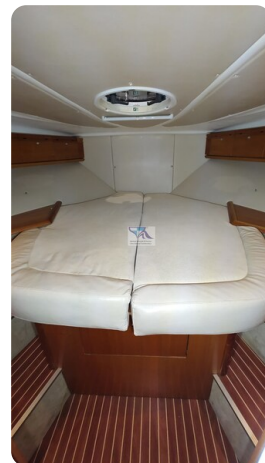
Bavaria 37 Sport msp793423 76