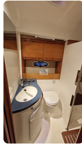
Bavaria 37 Sport msp793423 59