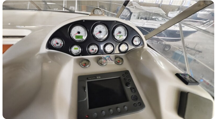
Bavaria 37 Sport msp793423 28