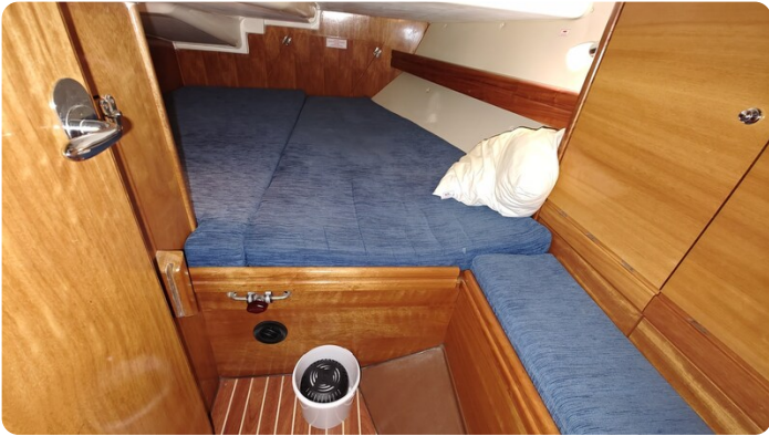
Bavaria 37 msp749314 15