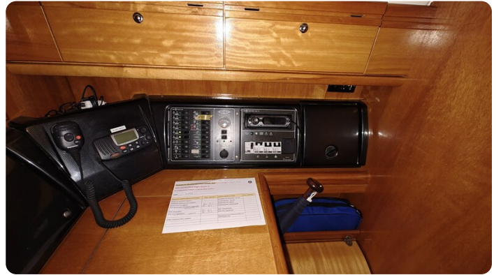
Bavaria 37 msp749314 16