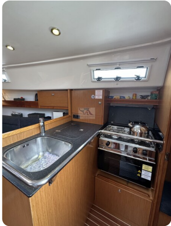
Bavaria 32 Cruiser HERON 38