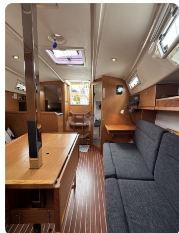
Bavaria 32 Cruiser HERON 34