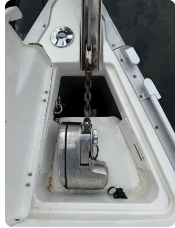
Bavaria 32 Cruiser HERON 68