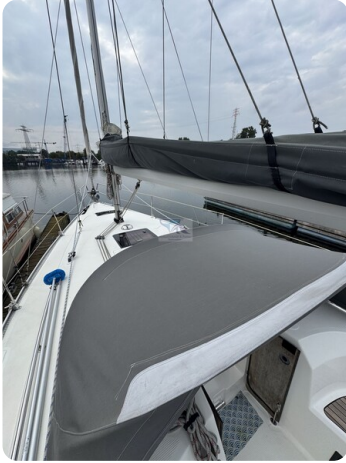
Bavaria 32 Cruiser HERON 61