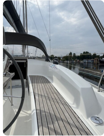
Bavaria 32 Cruiser HERON 57