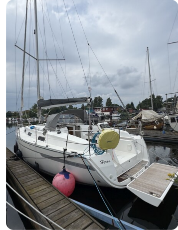
Bavaria 32 Cruiser HERON 2