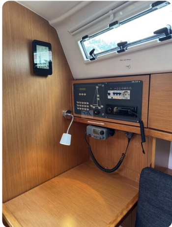
Bavaria 32 Cruiser HERON 35