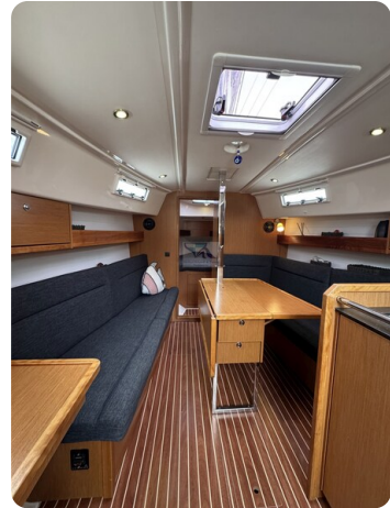
Bavaria 32 Cruiser HERON 41