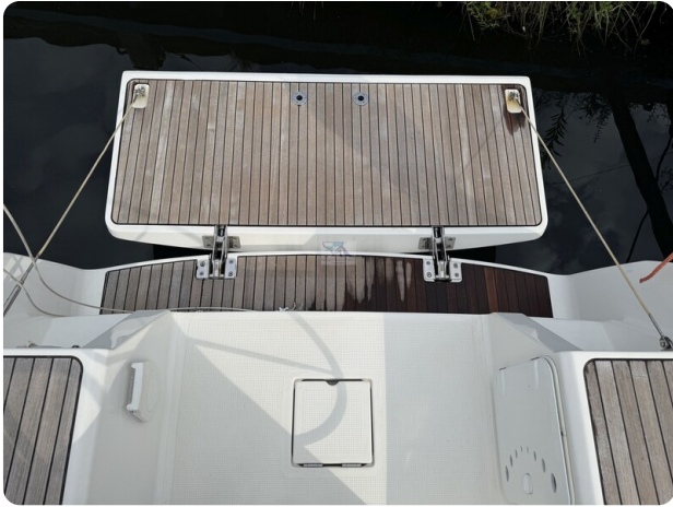
Bavaria 32 Cruiser HERON 59