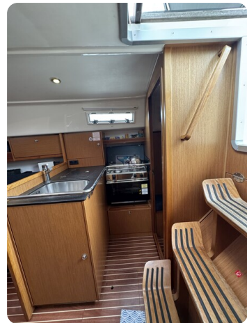
Bavaria 32 Cruiser HERON 40