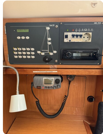
Bavaria 32 Cruiser HERON 36