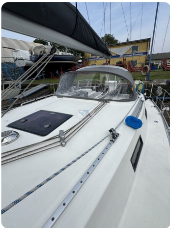
Bavaria 32 Cruiser HERON 63