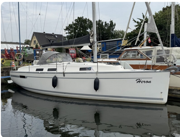
Bavaria 32 Cruiser HERON 6