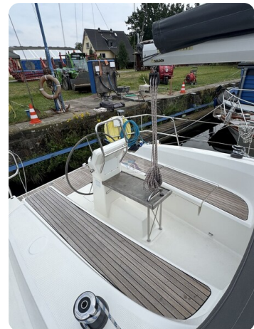
Bavaria 32 Cruiser HERON 45