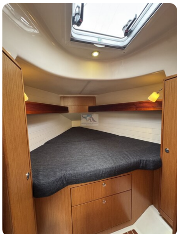
Bavaria 32 Cruiser HERON 30