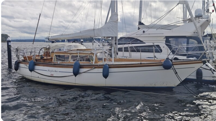
Baltika Decksalon SY 2