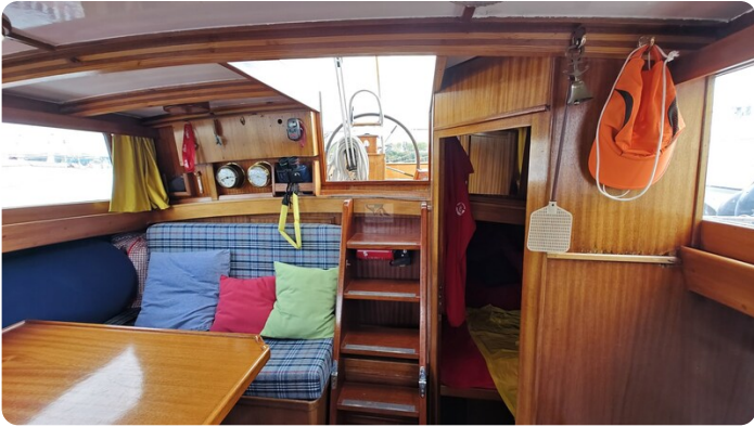
Baltika Decksalon SY 18