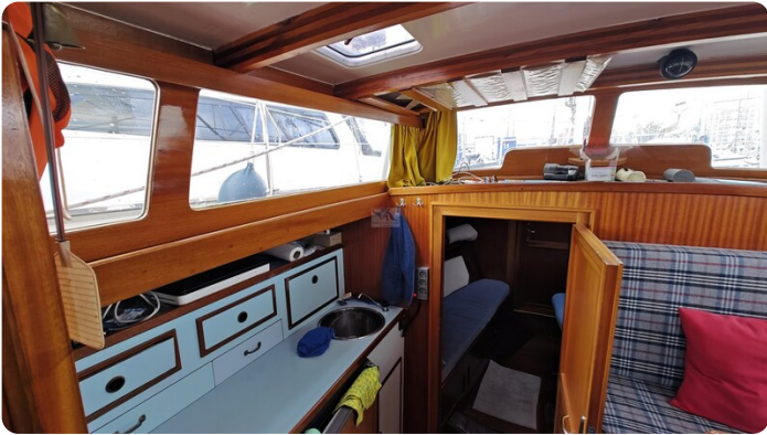
Baltika Decksalon SY 21