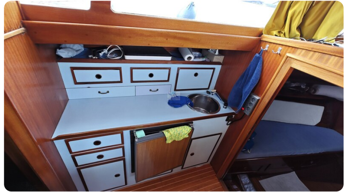
Baltika Decksalon SY 22