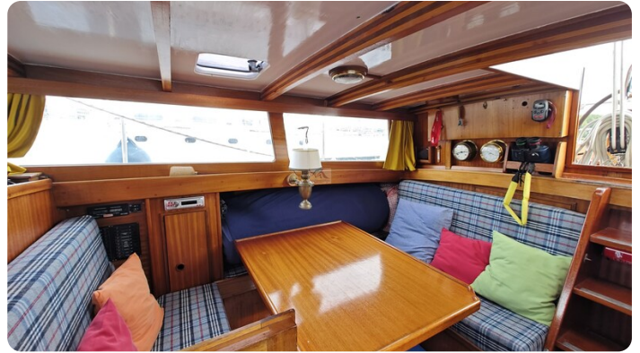
Baltika Decksalon SY 19