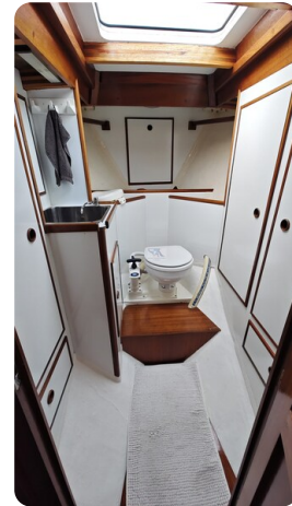
Baltika Decksalon SY 25