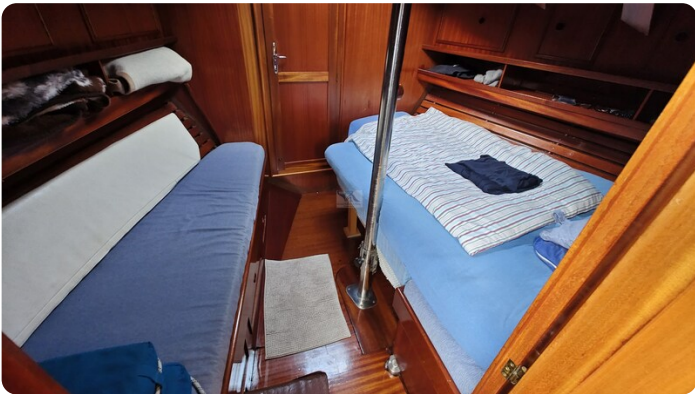
Baltika Decksalon SY 24