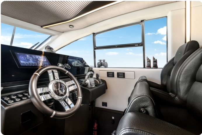
Azimut S7New helm station