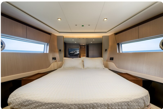
Azimut S7New Vip cabin