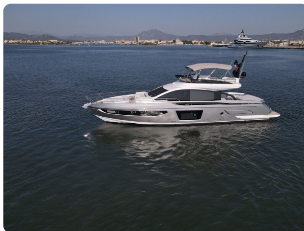
Azimut S7New aerial view