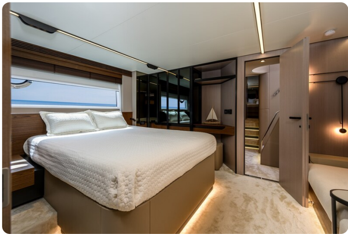
Azimut S7New, owner's cabin