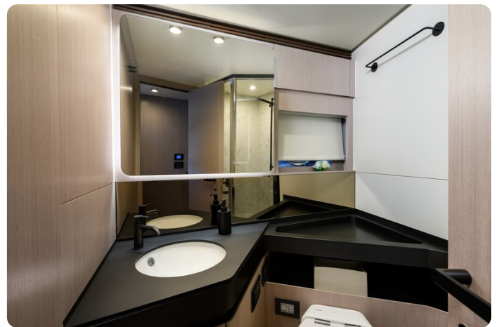
Azimut S7New Vip bathroom