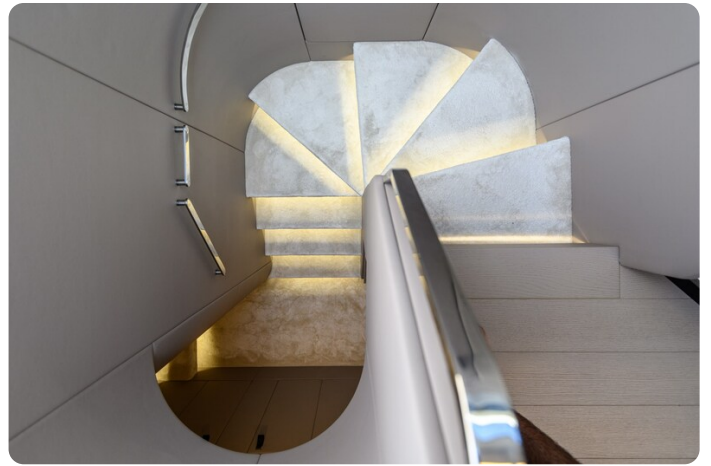
Azimut S7New interior details