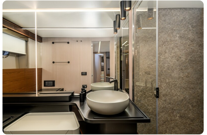
Azimut S7New ownr's bathroom