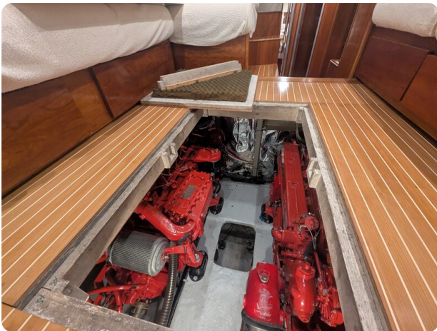
{1} Engine room