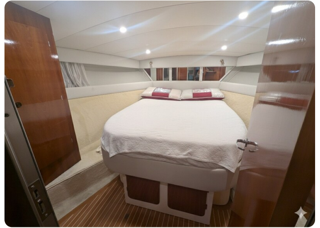
{1} Owner's cabin