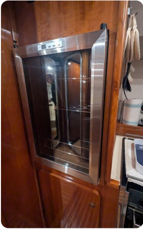
{1} Galley detail