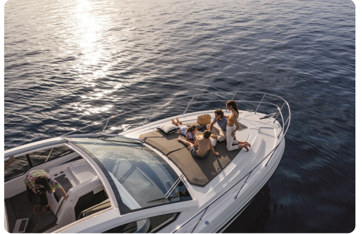
A45 Exterior View 2