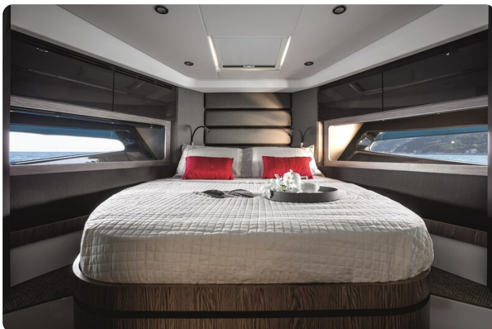
A45 Master Cabin