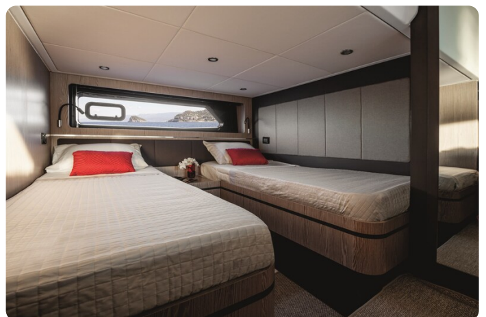
A45 Guest Cabin Twin beds