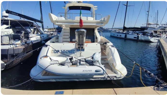
Az 62 Vista poppa