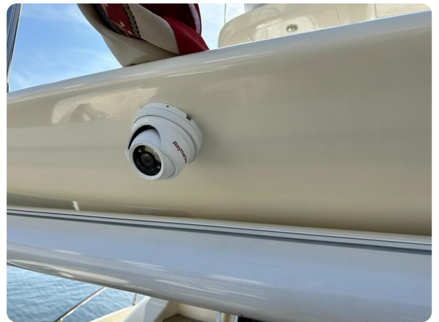
Az 62 Telecamera poppa