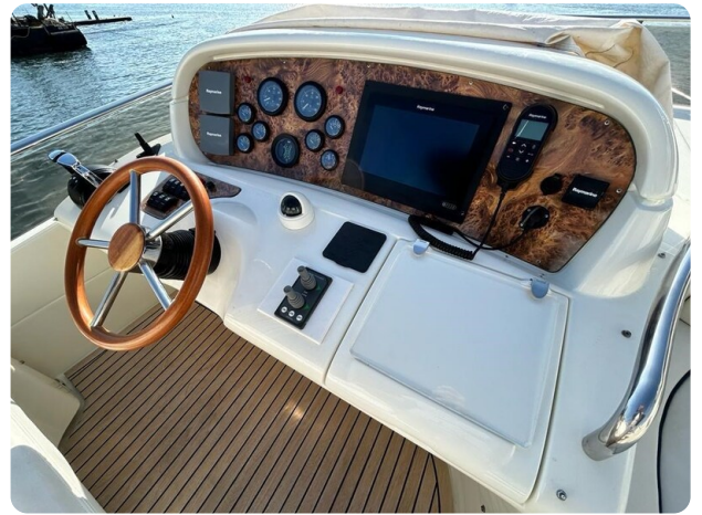
Az 62 Plancia di guida flybridge