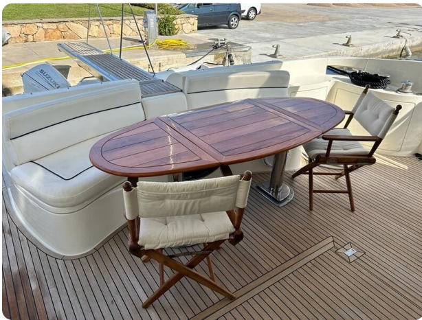
Az 62 Vista pozzetto