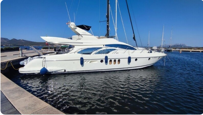
Az 62 Vista laterale