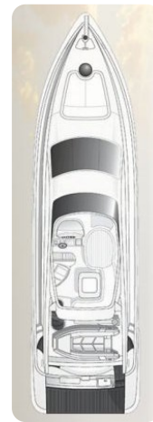
Layout Az 62