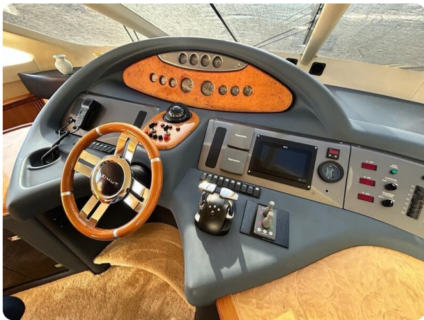
Az 62 Plancia Azimut 62 - dinette.1