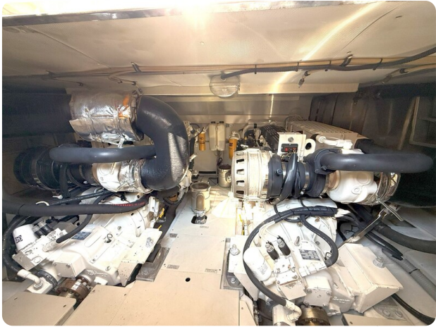
{1} Engine room