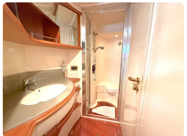
{1}Guest Head detail