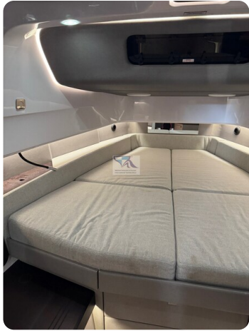
Axopar 45 32