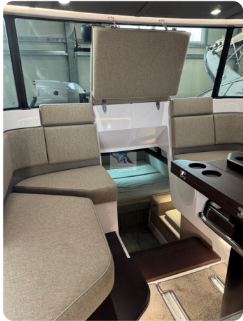
Axopar 45 39