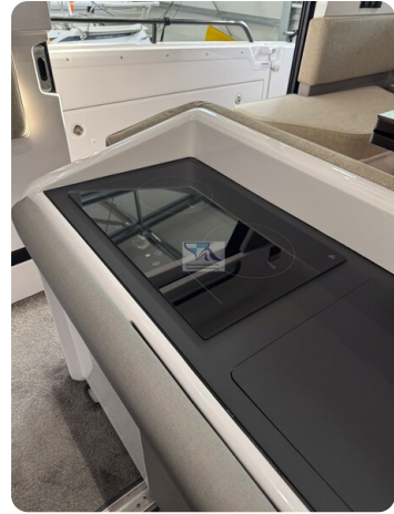
Axopar 45 36