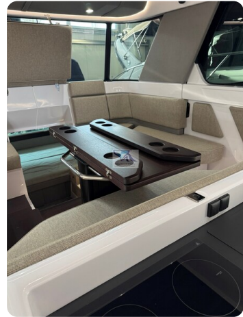
Axopar 45 38