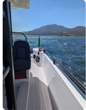
Axopar 37 Sun Top Brabus, side view