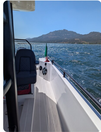
Axopar 37 Sun Top Brabus, side view