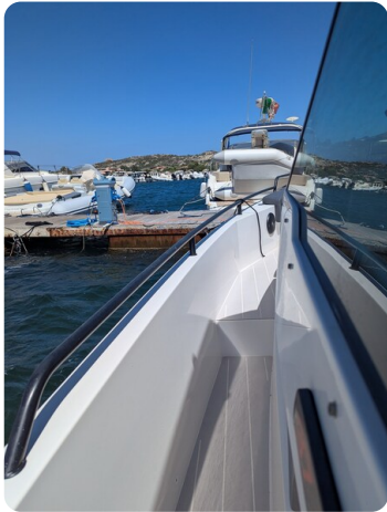
Axopar 37 Sun Top Brabus, port side view