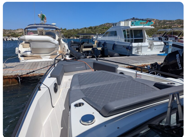
Axopar 37 Sun Top Brabus, bow sunpad