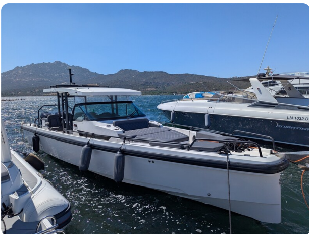
Axopar 37 Sun Top Brabus, bow view