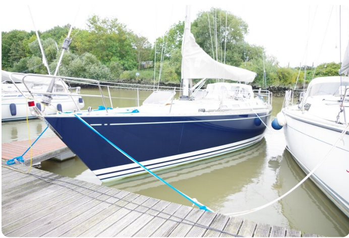
Avance 40 msp636285 3