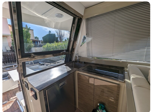
AP 44 Sedan galley