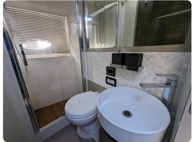
AP 44 Sedan guest bathroom