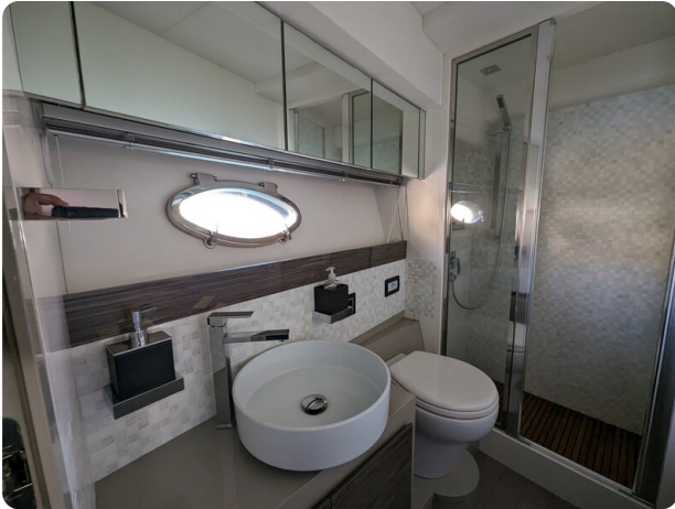
AP 44 Sedan owner's bathroom