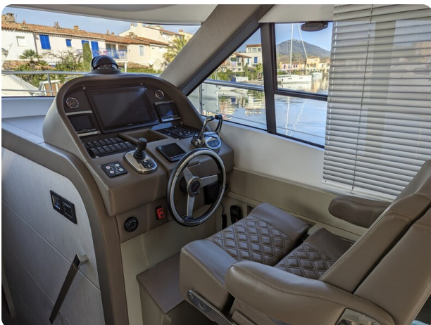
AP 44 Sedan helm station