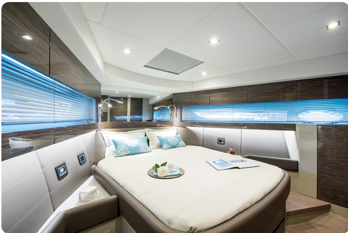
AP 44 Sedan owner's cabin