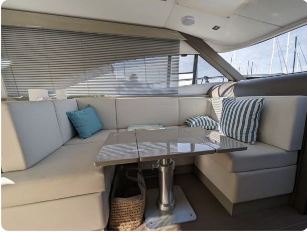
AP 44 Sedan dinette