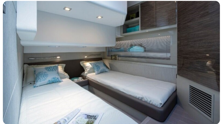
AP 44 Sedan guest cabin