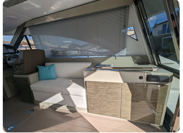
AP 44 Sedan interior detail