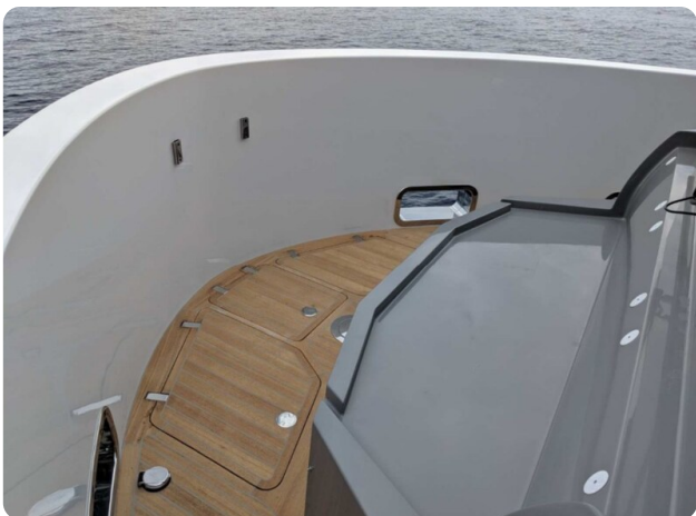
CIAO! fwd details