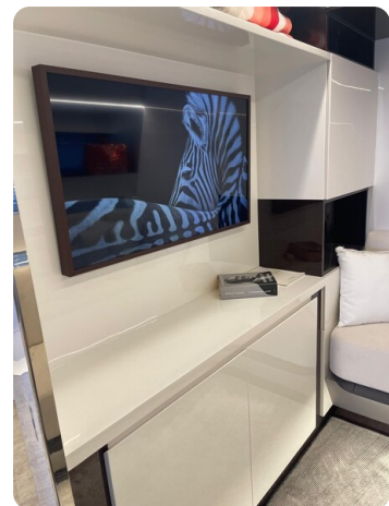
CIAO! room details