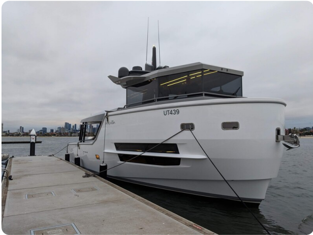
CIAO! profile fwd