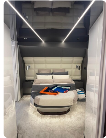
CIAO! cabin details