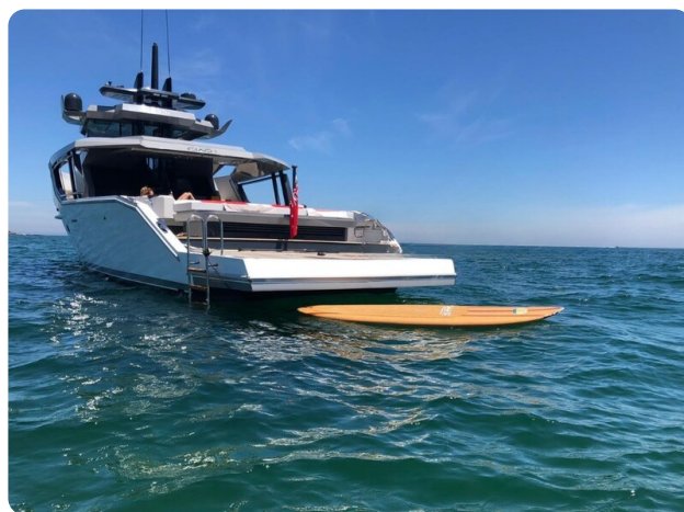
CIAO! profile bwd