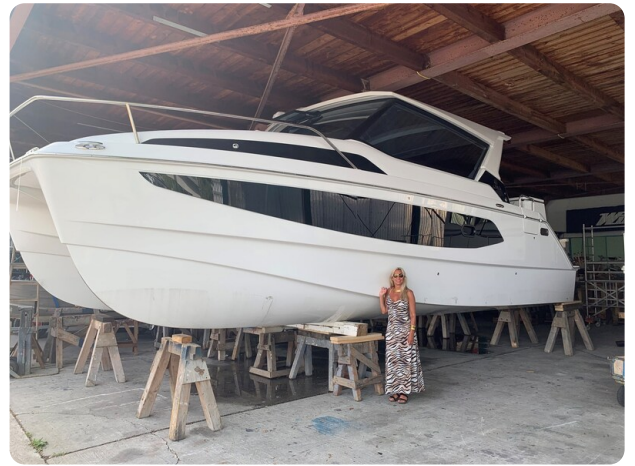
Aquila 36 Sport drydock