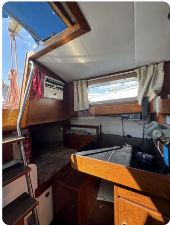
S & S 30 IVALU 51