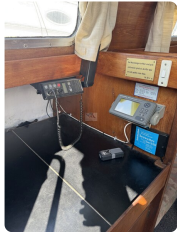
S & S 30 IVALU 50