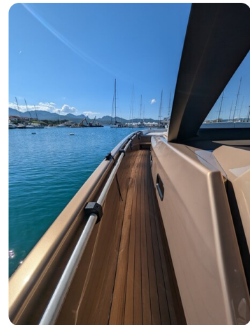
Apex 60 sideways