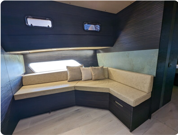
Apex 60 port dinette