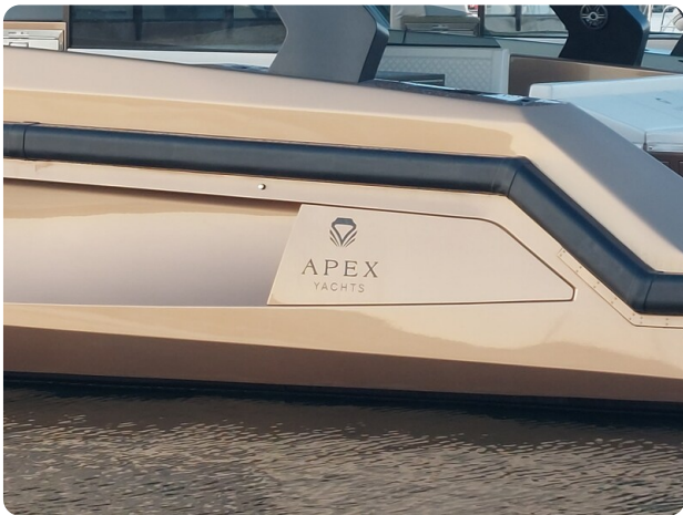
Apex 60 (3)