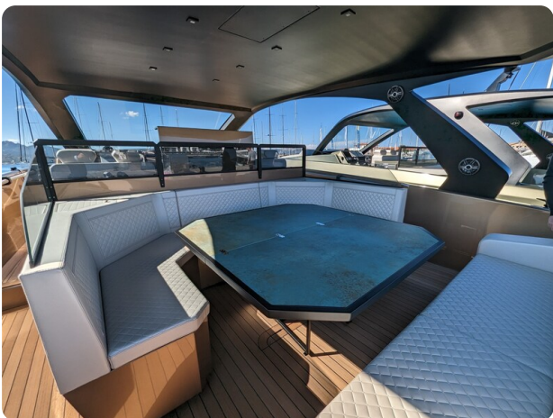
Apex 60 cockpit dinette