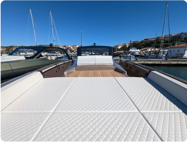
Apex 60 bow sunpad