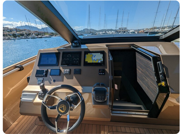
Apex 60 helm