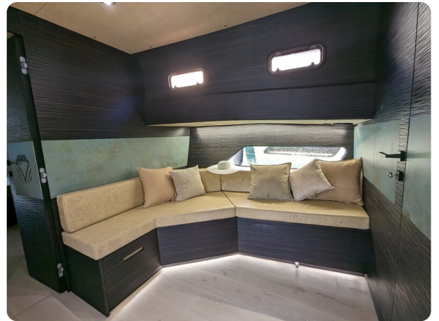
Apex 60 dinette