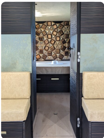
Apex 60 interiors