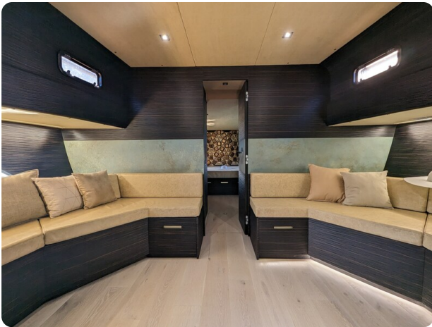
Apex 60 salon