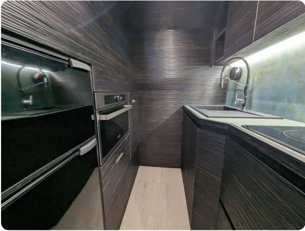
Apex 60 galley