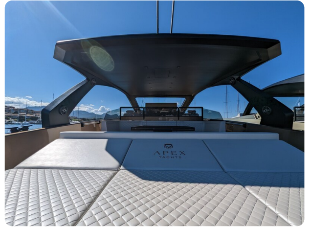
Apex 60 aft sunpad