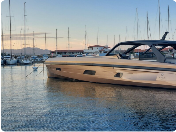
Apex 60 (2)