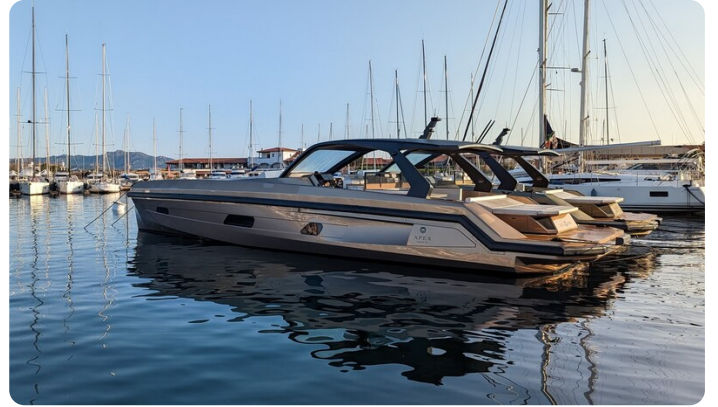
Apex 60 aft profile closed