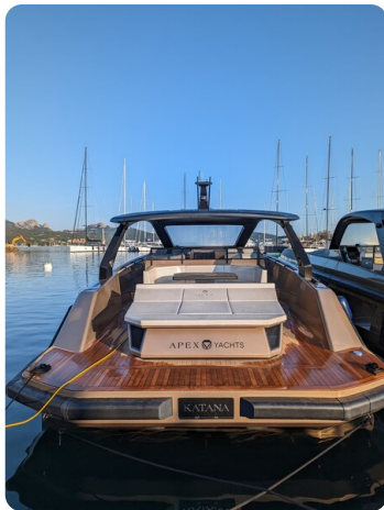
Apex 60 stern view