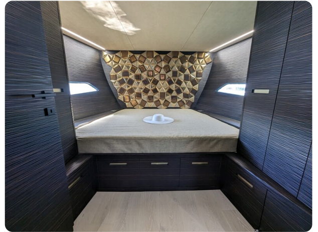
Apex 60 cabin