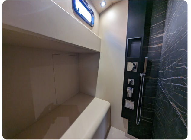
Apex 60 shower