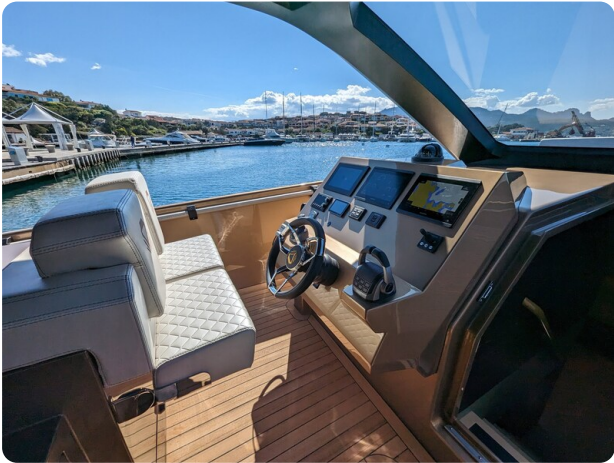
Apex 60 helm station