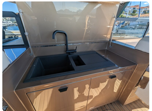
Apex 60 cockpit bar