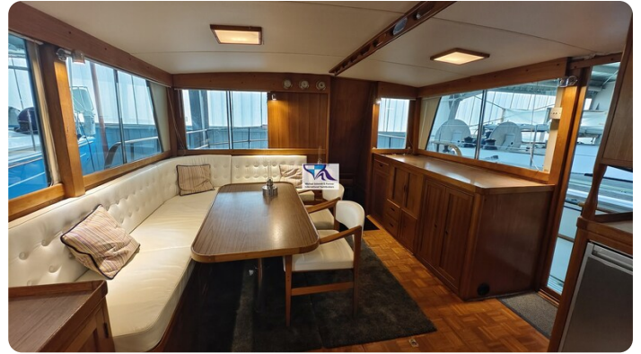
Grand Banks 48_msp789980 85