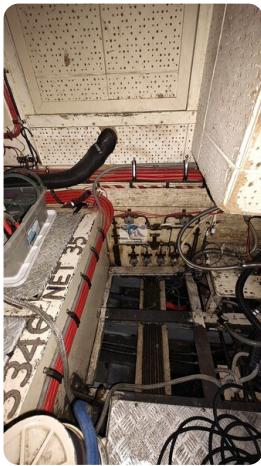
Grand Banks 48_msp789980 10