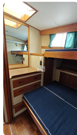
Grand Banks 48_msp789980 18