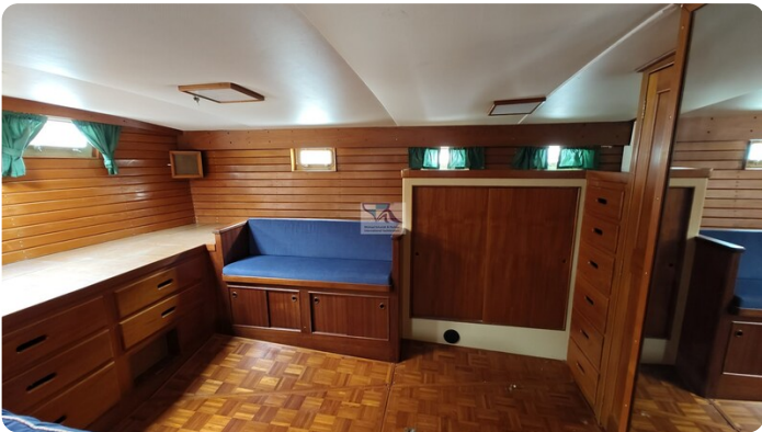
Grand Banks 48_msp789980 51