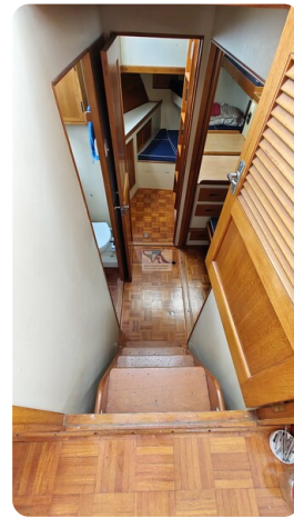
Grand Banks 48_msp789980 16