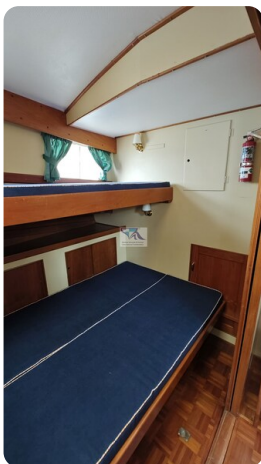
Grand Banks 48_msp789980 17