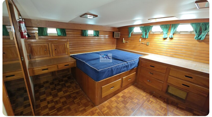
Grand Banks 48_msp789980 48