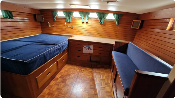
Grand Banks 48_msp789980 50