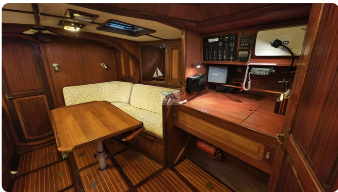
Feltz Alu One Off_42