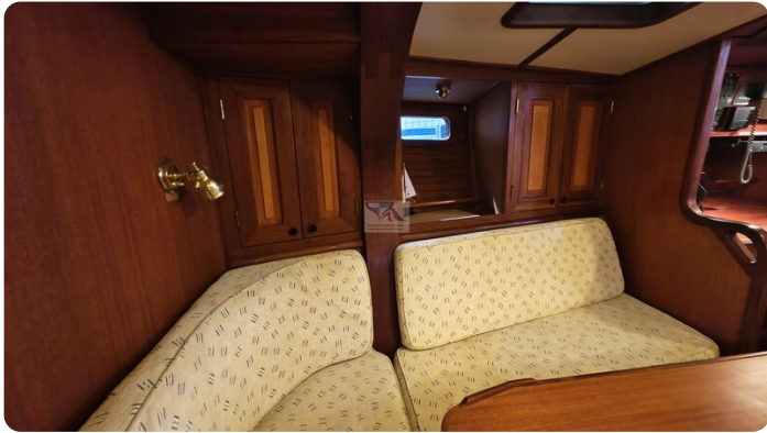
Feltz Alu One Off_52