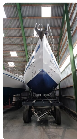
Feltz Alu One Off_2