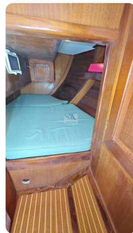
Feltz Alu One Off_77