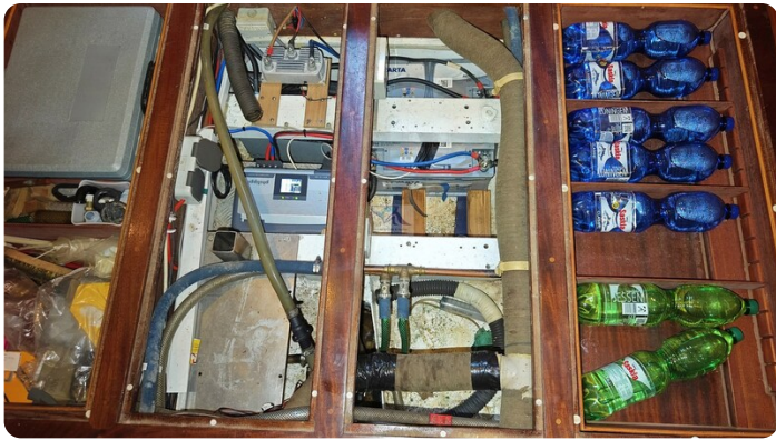
Feltz Alu One Off_68