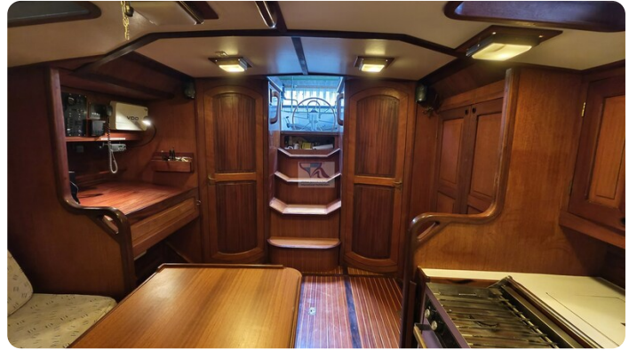
Feltz Alu One Off_49