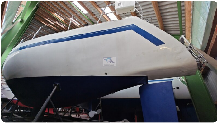
Feltz Alu One Off_8