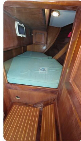
Feltz Alu One Off_76