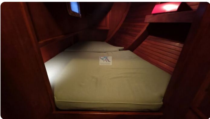
Feltz Alu One Off_75