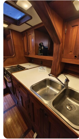
Feltz Alu One Off_66