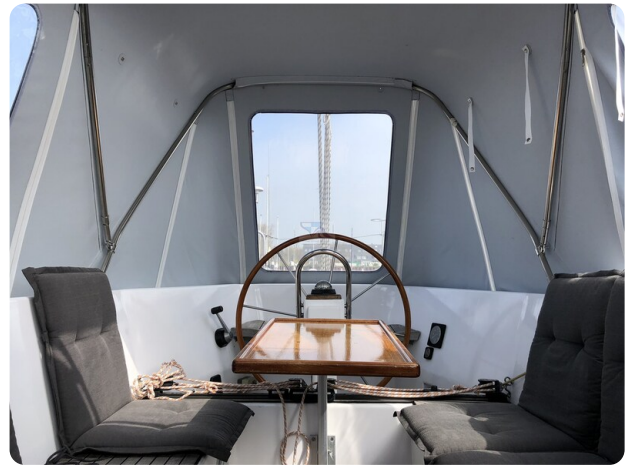
Feltz Alu One Off_89