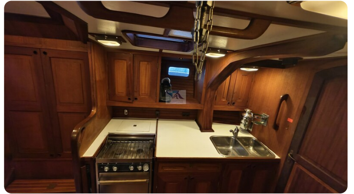
Feltz Alu One Off_53