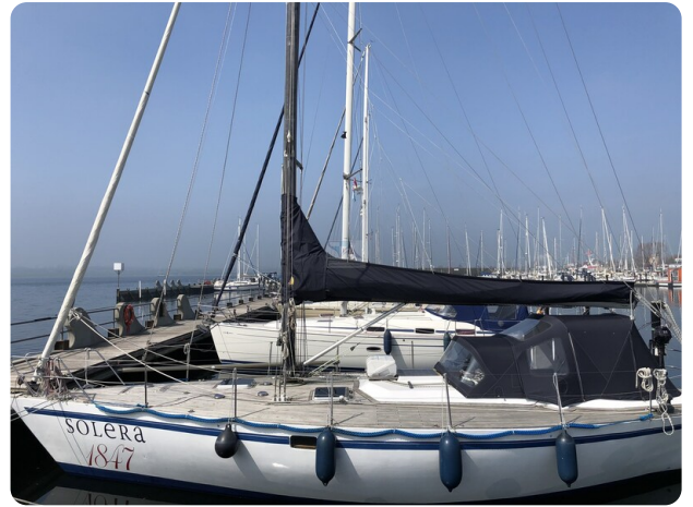
Feltz Alu One Off_113