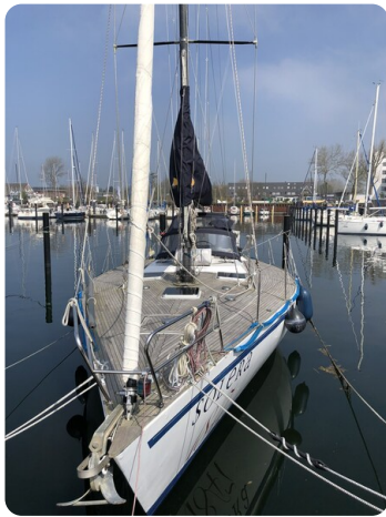
Feltz Alu One Off_111