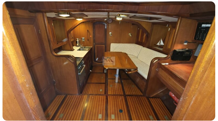
Feltz Alu One Off_39