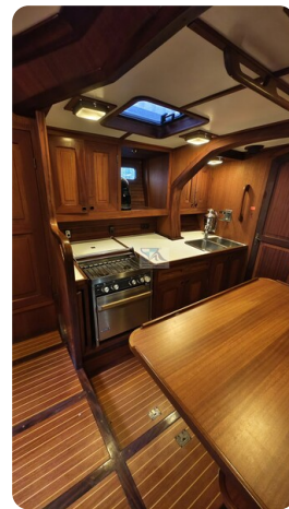
Feltz Alu One Off_44