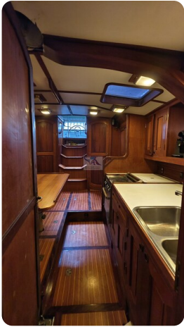
Feltz Alu One Off_61