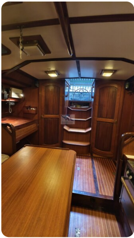
Feltz Alu One Off_48