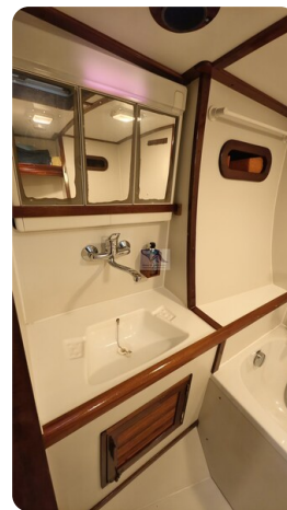
Feltz Alu One Off_60