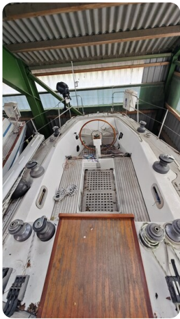
Feltz Alu One Off_27