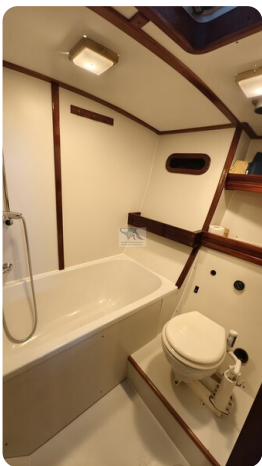
Feltz Alu One Off_58