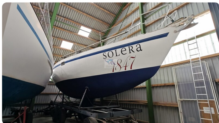
Feltz Alu One Off_1