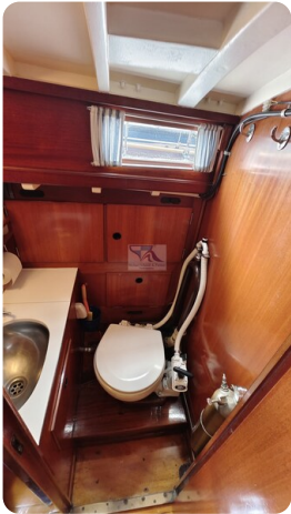
6 KR A&R Kielschwertyacht 25