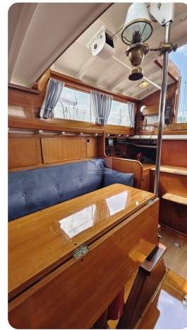
6 KR A&R Kielschwertyacht 10