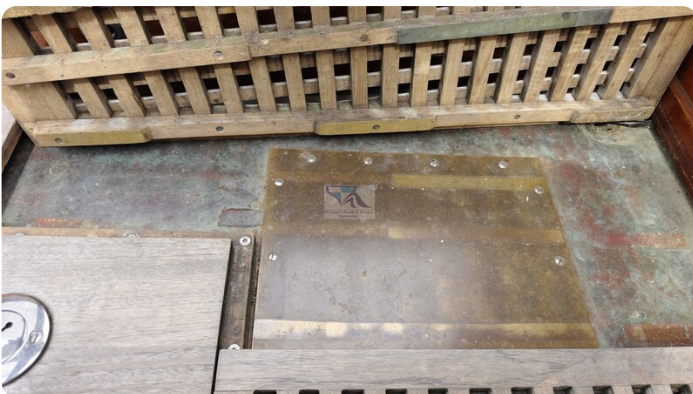
6 KR A&R Kielschwertyacht 74