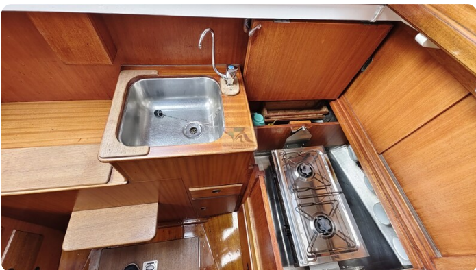
6 KR A&R Kielschwertyacht 16