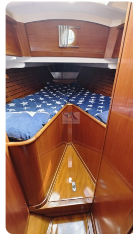
6 KR A&R Kielschwertyacht 21