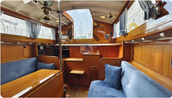
6 KR A&R Kielschwertyacht 6