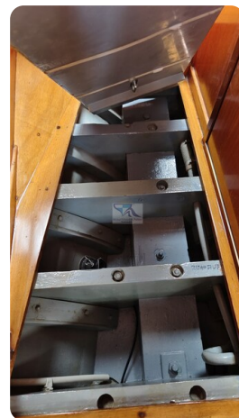
6 KR A&R Kielschwertyacht 33