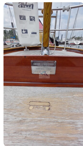
6 KR A&R Kielschweryacht 46