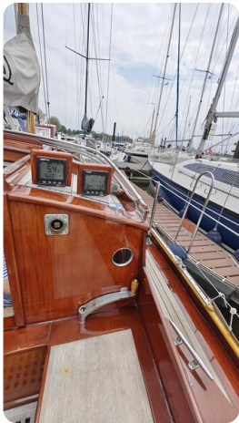
6 KR A&R Kielschwertyacht 47