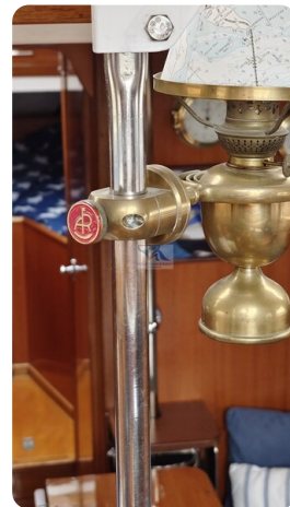
6 KR A&R Kielschweryacht 78