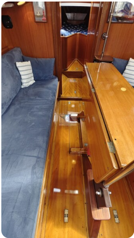
6 KR A&R Kielschwertyacht 20