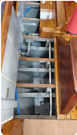
6 KR A&R Kielschweryacht 36