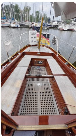
6 KR A&R Kielschweryacht 45