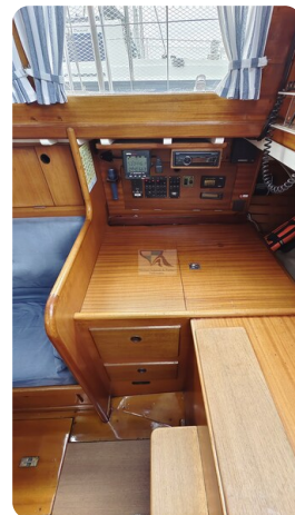
6 KR A&R Kielschwertyacht 17