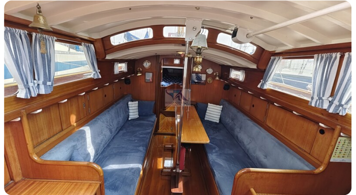
6 KR A&R Kielschwertyacht 1