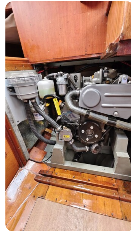
6 KR A&R Kielschweryacht 39