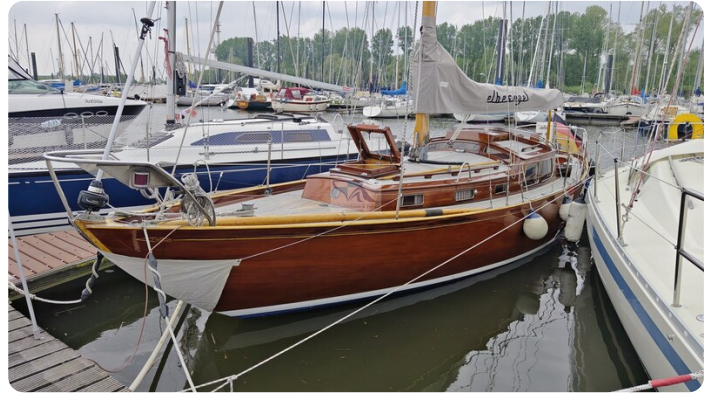
6 KR A&R Kielschweryacht 53