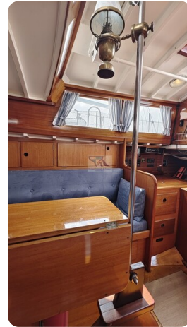
6 KR A&R Kielschwertyacht 32