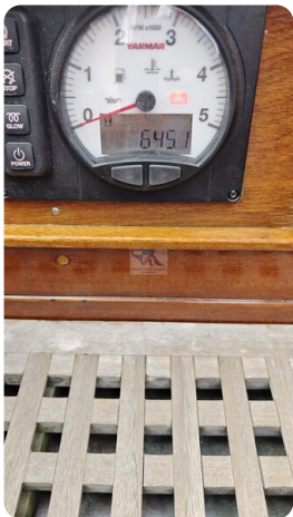
6 KR A&R Kielschweryacht 79