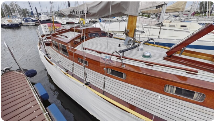
6 KR A&R Kielschweryacht 59